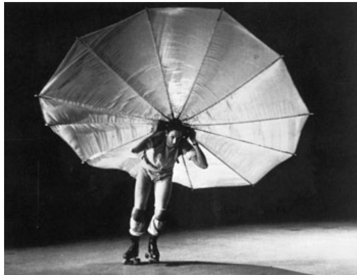
Figura 3 - Robert Rauschenberg em Pelican em 1965 no First New York Theater Rally.

e do pintor Per Olof Ultvedt era andar de patins com um pára-quedas aberto nas costas, enquanto a bailarina Carolyn Carlson realizava sequências de movimentos da técnica do balé clássico sobre sapatilhas de ponta (Kotz, 2004). Quando imaginamos uma pista de patinação podemos inferir a mudança de percepção da platéia em relação ao espaço cênico, especialmente em comparação ao palco italiano.