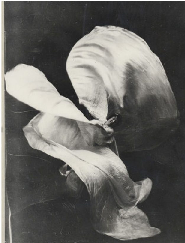
Figura 1 – “Serpentine dance” de Loie Füller em 1902.

O coreógrafo norte-americano Merce Cunningham 3 modificou diversos cânones da dança moderna -- “Dentre outras premissas básicas, sua proposta artística determinava que qualquer espaço seria passível de ser coreografado, fosse ele construído ou não para fins cênicos” (Silva, 2007:25). Suas obras são exemplos de experimentos sobre certa independência que pode ser exercida entre o movimento corporal, objetos sonoros e espaço cenográfico: “os bailarinos ensaiavam sem conhecer a música, o músico compunha sem a coreografia, e o cenógrafo criava sozinho em seu estúdio” (Stuart, 1999: 198). Os cenários de seus espetáculos desenvolvidos por artistas como Robert Rauschenberg, Remy Charlip e Jasper Johns, realizados independentemente da dança, e da música de John Cage, eram objetos interessantes e autônomos em si-mesmos, como se pode observar na Figura 2. “A cenografia evoluiu de um simples elemento de adorno para ter um significado essencial e autônomo (...), podendo, inclusive, ser admirada por si própria” (Silva, 2007:24). A complexidade de relações possíveis entre os diferentes sistemas e processos era realizada nas