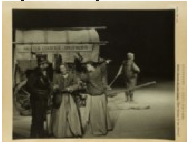
Fotografia 7 - Mãe Coragem e seus filhos